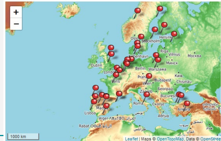
Studienkooperationen des Fachbereichs